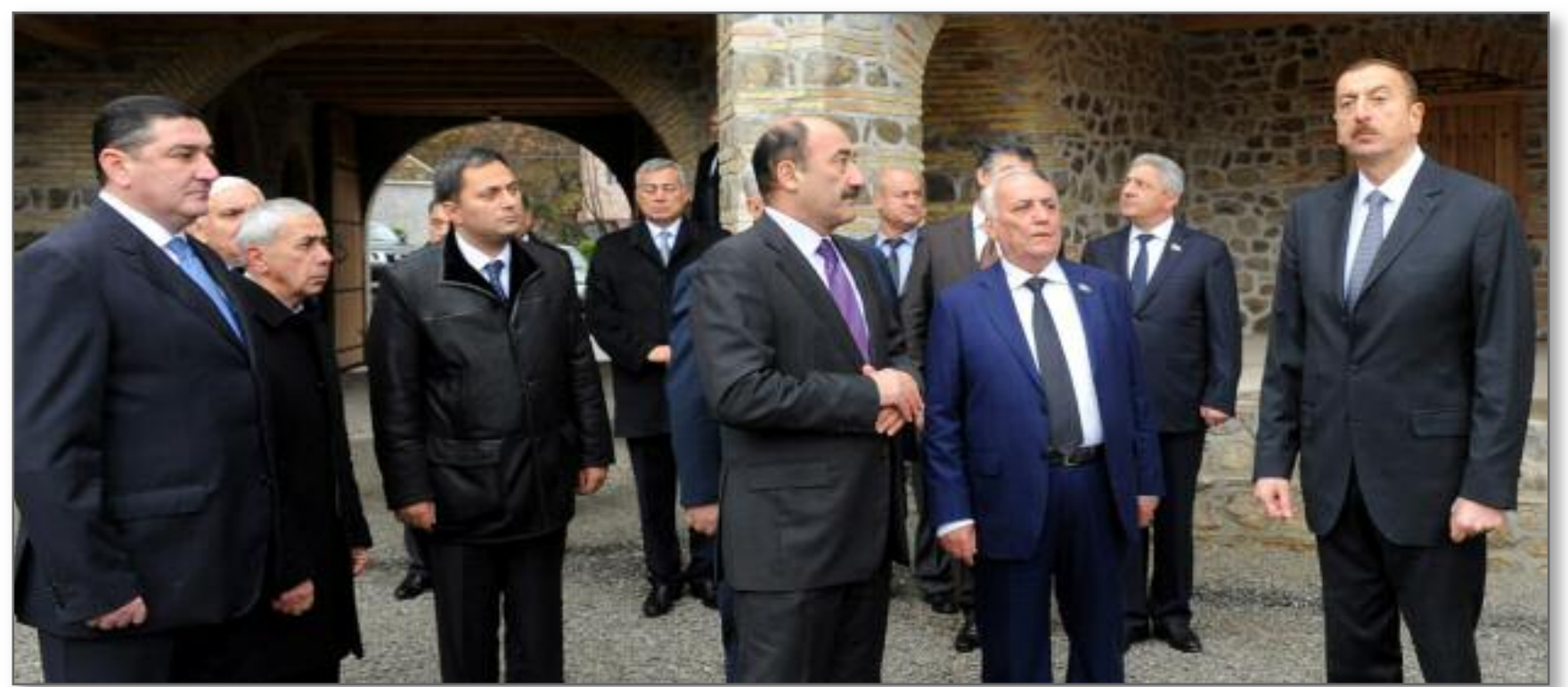
Şəkilə: Prezident İlham Əliyev Şəki şəhərində "Aşağı Karvansaray" kompleksində aparılan təmir-bərpa işləri ilə tanış olur

Əsas bina altı korpusdan ibarətdir. Birinci və ikinci korpuslar üçmərtəbəli, üçüncü və dördüncü korpuslar ikimərtəbəli, digər iki korpus isə birmərtəbəlidir. Burada təcili tibbi yardım, reanimasiya, iki cərrahiyyə, onkoloji xəstəliklər,