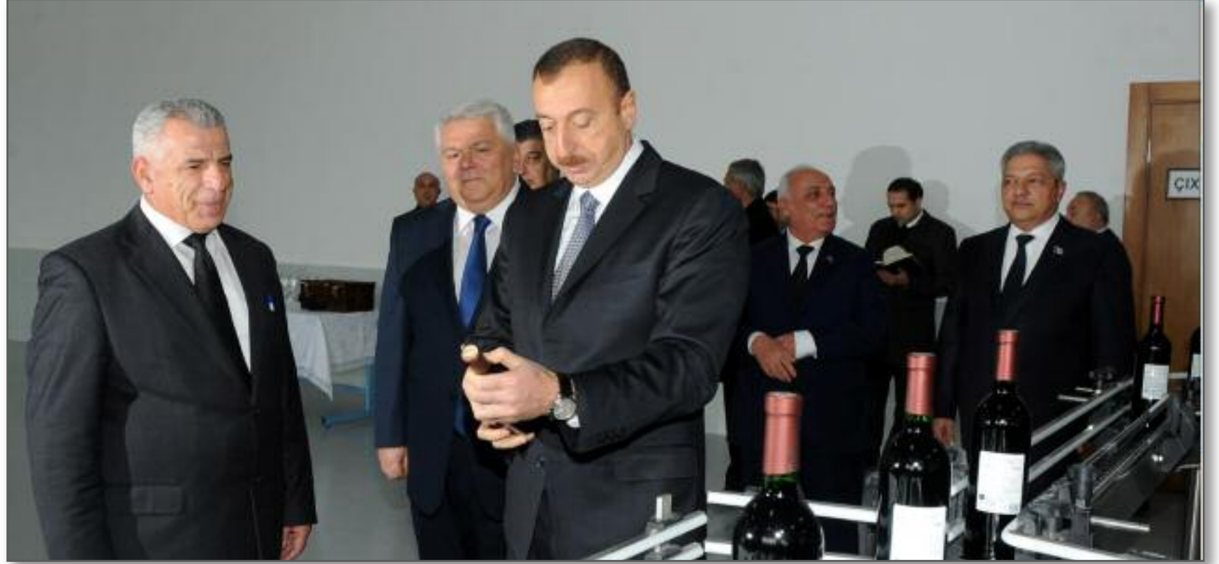
Şəkildə: Prezident İlham Əliyev Şəki şərab zavodunun qablaşdırma sexi ilə tanışlıq zamanı

Prezident İlham Əliyev görülmüş işləri yüksək qiymətləndirdi, kollektivə uğurlar arzuladı.