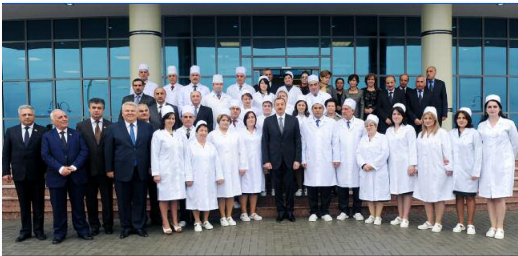
Şəkilə: Prezident İlham Əliyev Şəki şəhərindəki Mərkəzi Xəstəxananın kollektivi və Şəki ictimaiyyətinin nümayəndələri ilə birlikdə

Prezident İlham Əliyev tikinti və bərpa işlərinin yüksək keyfiyyətlə yerinə yetirilməsinə, eləcə də karvansaranın gələcəkdə istifadəsinə dair tapşırıq və tövsiyələrini verdi.