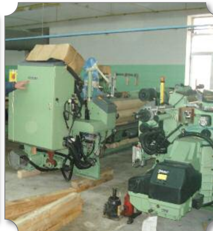
Şəkildə: Almaniya satın alınmış yeni toxucu dəzgahı